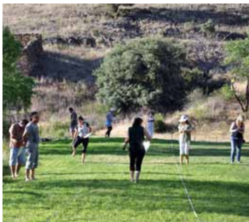
05 > I ENCUENTRO DE GEAPRO EN GRUPOS DE ZONA.